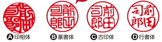
A 印相体 B 篆書体 C 古印体 D 行書体