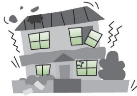
地震・噴火を原因とする 損壊・埋没