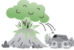
地震・噴火を原因とする 火災